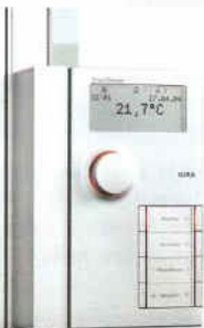
Smart Sensor firmy Gira do sterowania wieloma funkcjami w pomieszczeniu. TEMA